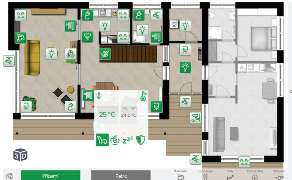
Příklad vizualizace pro tablet a počítač

nu, která vám spustí televizi, ztlumí osvětlení, zatáhne žaluzie a upraví teplotu v místnosti přesně tak, jak si přejete.