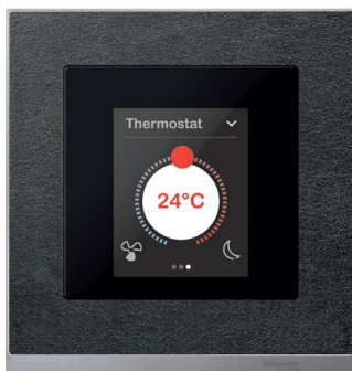
KNX Multitouch Pro

Uživatelské rozhraní pro vzorový dům bylo navrženo podle posledních trendů tak, abyste měli na jeden klik přehled o celé domácnosti. Ovládání jednotlivých technologií je řešeno ikonami. Vizualizace byla optimalizována pro rozlišení tabletu, který je návštěvníkům domu k dispozici pro vlastní otestování systému. Pro použití v chytrých telefonech je dostupná velmi přehledná zjednodušená verze.